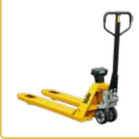
1100/1200 mit Waage